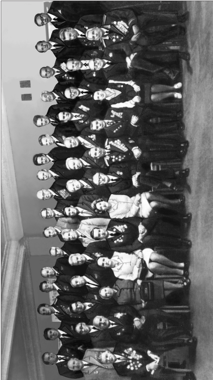
Сотрудники ИМЭМО — участники Великой Отечественной войны в день 25-летия Победы, 9 мая 1970 г.