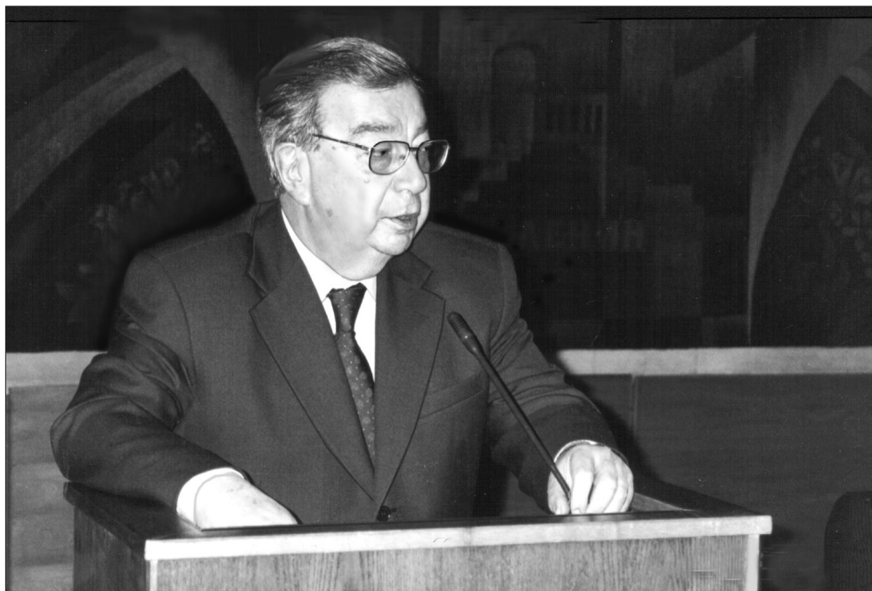
Академик Евгений Максимович Примаков, директор ИМЭМО в 1985–1989 гг.

за становлением других «центров силы» в мировой экономической системе, в частности в Азиатско-Тихоокеанском регионе.