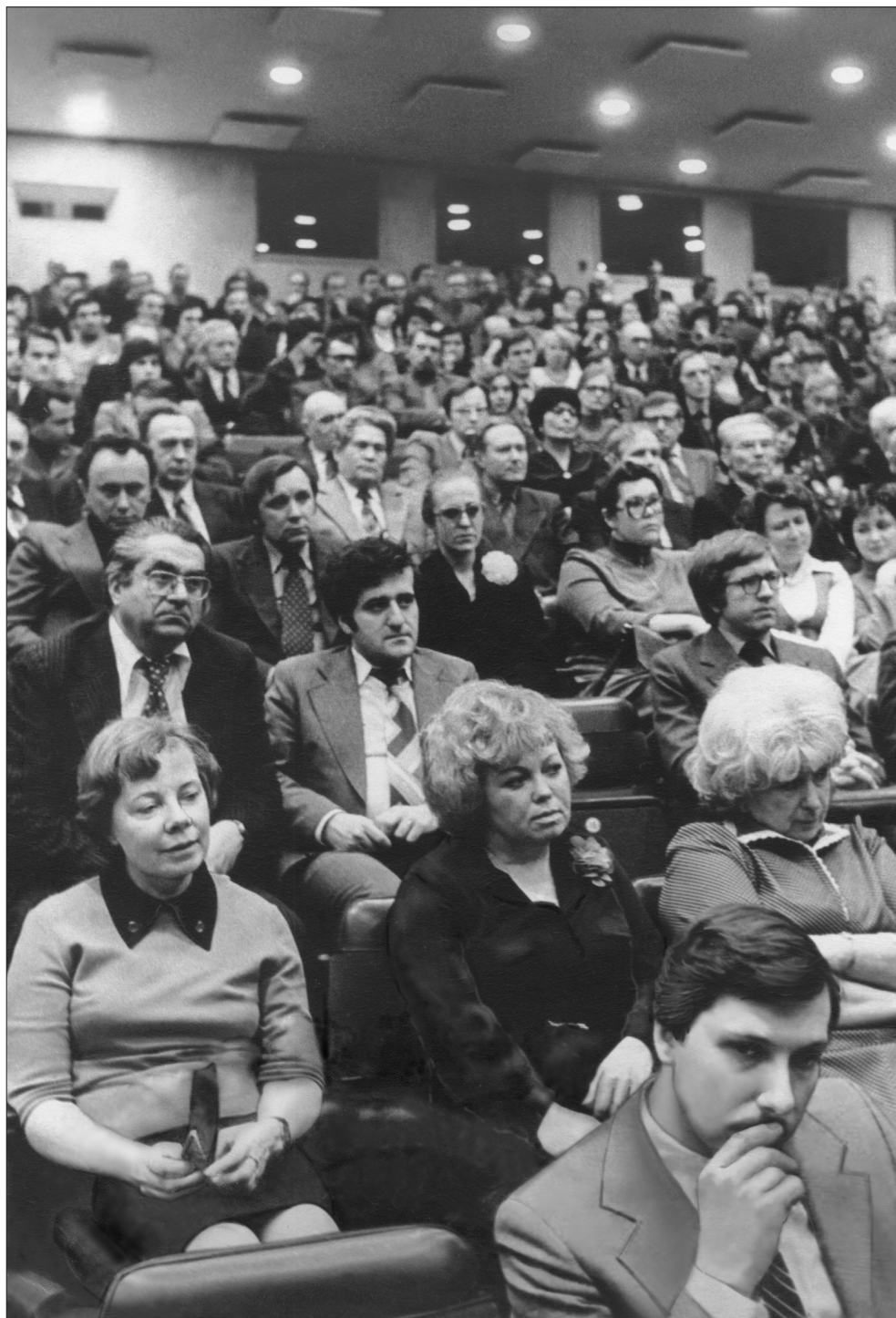
В актовом зале ИМЭМО (1980 г.)