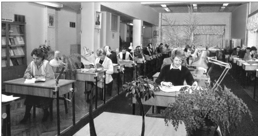
В читальном зале библиотеки ИМЭМО

МВТ и Президиум АН СССР Институтом было направлено 442 материала (аналитические и информационные записки и доклады). Разработки, подготовленные в ИМЭМО, вошли в директивные документы XXV (1976) и XXVI (1981) съездов КПСС, а также ряда пленумов ЦК.