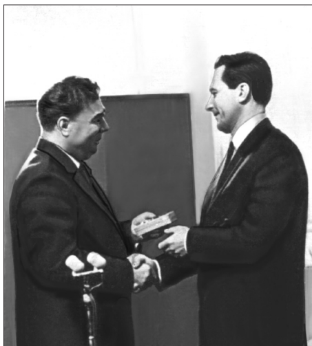
Л.И. Брежнев вручает Н.Н. Иноземцеву орден Ленина (1975 г.)

сотрудников ИМЭМО. Несколько десятков человек с семьями, долгие годы и даже десятилетия стоявшие в очереди на жилье, неожиданно получили новые благоустроенные квартиры, причем в непосредственной близости от места работы.