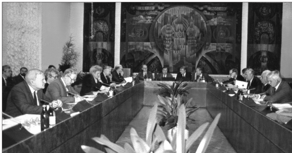
В ИМЭМО принимают делегацию Германского общества внешней политики (ФРГ)