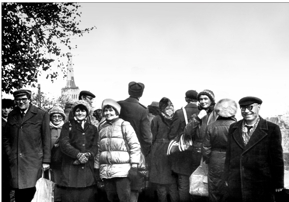
Группа сотрудников ИМЭМО на экскурсии в г. Таллине (Эстония). Начало 80-х гг.

По ходу работы изменились первоначальные хронологические рамки книги (1956—1991 гг.). Очень скоро мне стало ясно, что начинать историю ИМЭМО следует не с 1956-го, когда он был создан, а с 1947 г., когда был закрыт