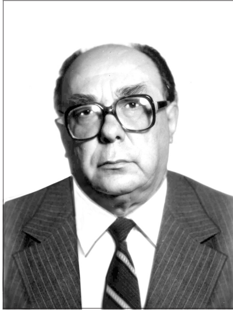
Академик Александр Николаевич Яковлев, директор ИМЭМО в 1983—1985 гг.

Но начиналось все, как я уже сказал, с расчистки наслоений сталинского «идейного» наследия в области экономической науки, определявшего мировоззрение правящей элиты и общества в целом.