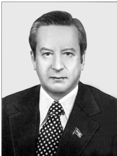
Академик Николай Николаевич Иноземцев, директор ИМЭМО в 1966–1982 гг.

публикациях ИМЭМО и отдавалась некая обязательная дань идеологическим установкам. Но даже это делалось так, что подготовленный читатель получал богатую пищу для собственных размышлений.