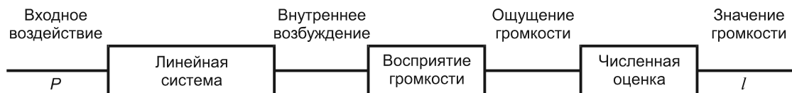
Рисунок С.1 — Блок-схема модели процесса оценки громкости

На рисунке С.1 приведена блок-схема описанной модели.